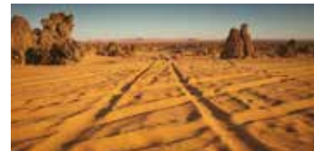
Para arena, nieves profundas, etc.