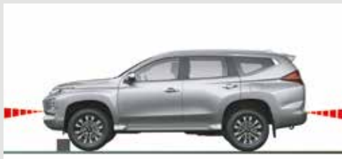
SISTEMA ULTRASÓNICO DE MITIGACIÓN DE ACELERACIÓN POR ERROR (UMS)