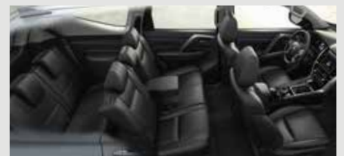
ASIENTOS ERGONÓMICOS 7 Puestos