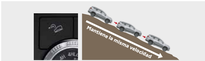
CONTROL DE DESCENSO EN PENDIENTES [HDC]

El cuerpo contorneado, resistente y aerodinámico, contribuye a un manejo sólido y de alto rendimiento brindándole máxima estabilidad en la carretera. La confiable tracción 4WD se combina con una suspensión avanzada para mantenerlo en contacto con diferentes condiciones de las superficies, logrando un control firme.