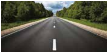
Para condiciones normales de la carretera.