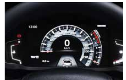
PANTALLA DE INFORMACIÓN MÚLTIPLE LCD A COLOR DE 8"