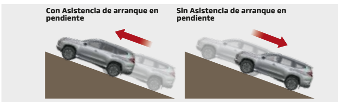
ASISTENCIA DE ARRANQUE EN PENDIENTE

Regula independientemente la fuerza de frenada durante las curvas para ayudar a mantener la estabilidad del vehículo, siempre que sea necesario.