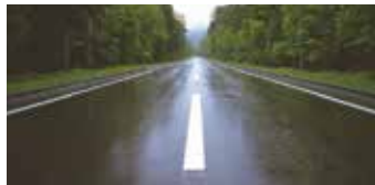
Para carreteras en mal estado.