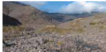
Para superficies de bajo agarre.