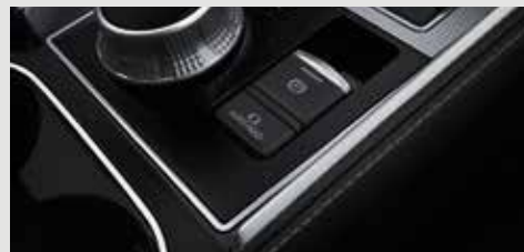
FRENO DE ESTACIONAMIENTO ELECTRÓNICO Y AUTO HOLD