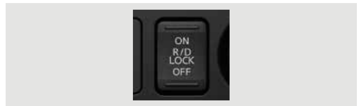
BLOQUEO DIFERENCIAL TRASERO

Ayuda a evitar que el vehículo se ruede hacia atrás mientras se libera el freno.